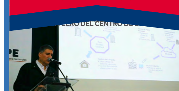
PUESTA A CERO DEL CENTRO DE CÓMPUTO