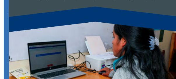
USO DE LA SOLUCIÓN TECNOLÓGICA DE APOYO AL ESCRUTINIO (STAE)