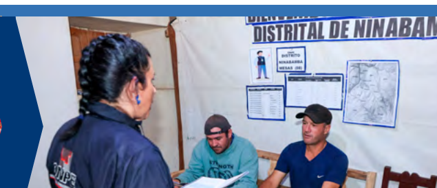
CAPACITACIÓN DE PERSONEROS