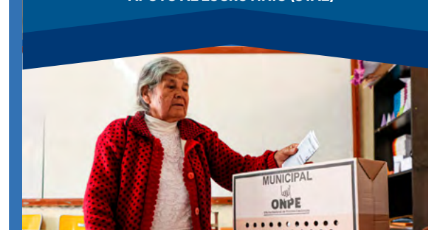
MESAS ESPECIALES PARA PERSONAS CON DISCAPACIDAD