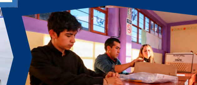
MIEMBROS DE MESA